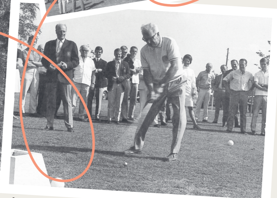
Invigningsslaget för blå slinga