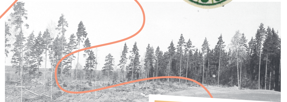
Arbete vid bygget av gul slinga