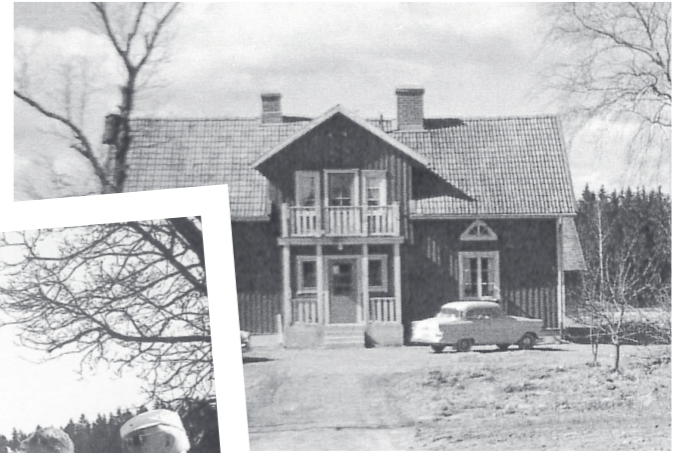
Arbete med klubbhusets första altan.

Nu är tiden inne för att nästa steg. Masterplan 2027. Under vårmötet kommer vi informera om projektet och hur vi kommer utveckla banan så vi kan utveckla och uppleva vår bästa golf i 70 årt till.