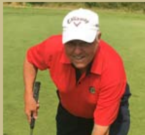
Plåtade och skrev Bo Dahlgren

Med ert breda kunnande kommer klubbens seniorer att nå längre och högre, och bli gladare golfare.