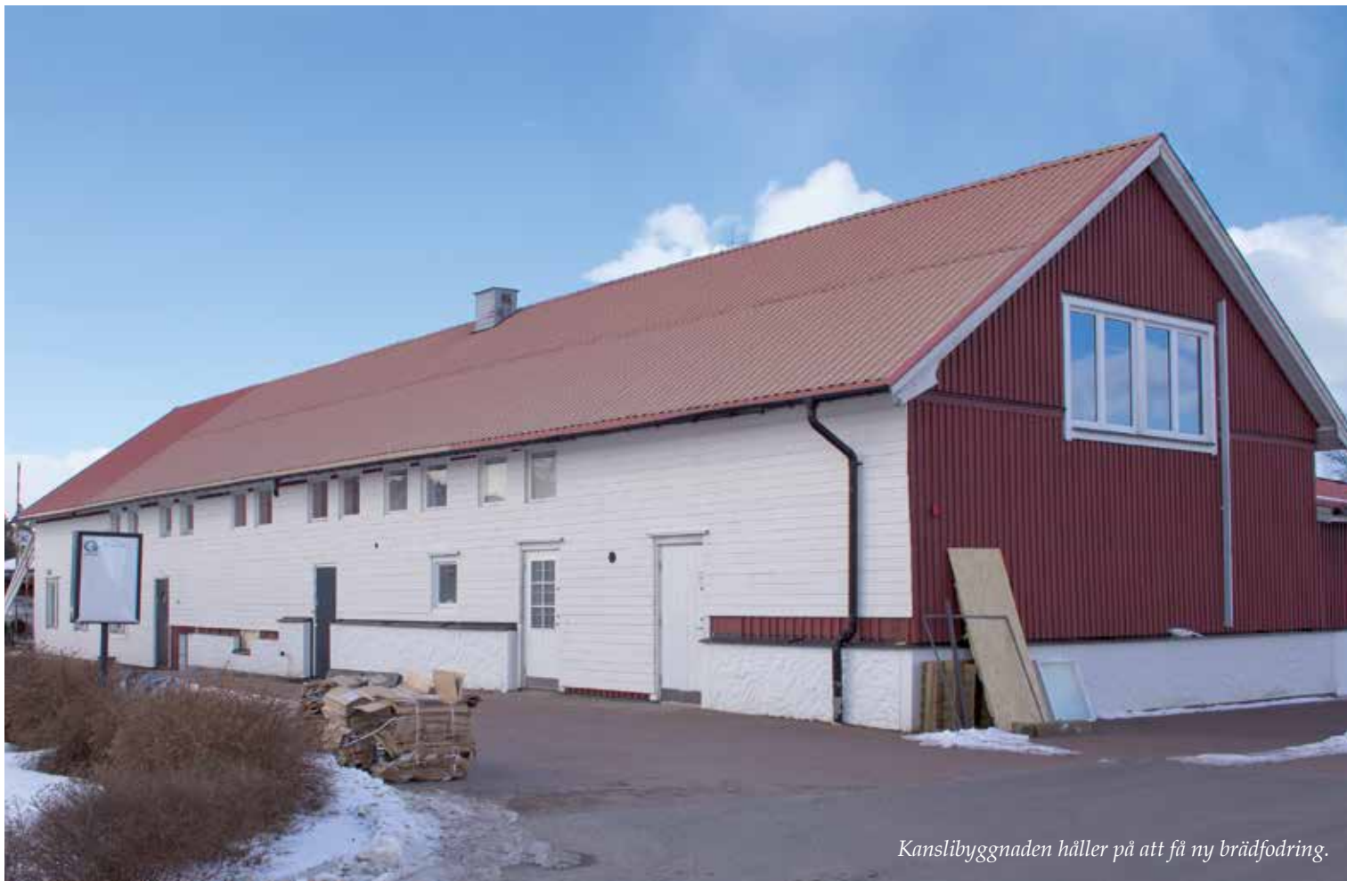
Kanslibyggnaden håller på att få ny brädfodring.