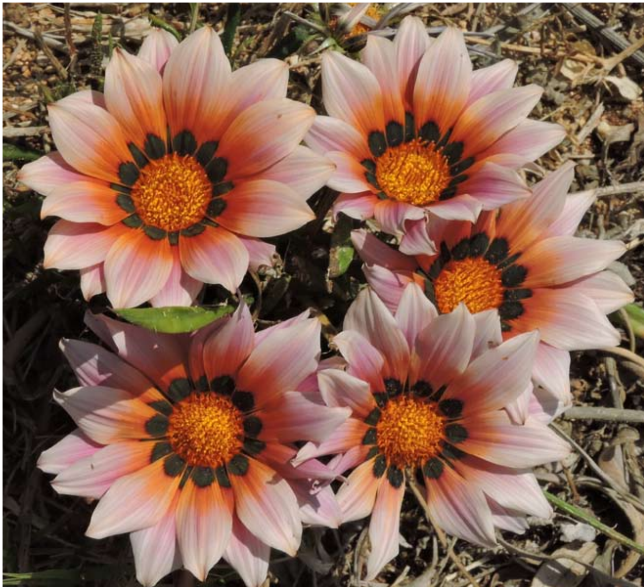
Många vackra blommor lyste mot oss utefter banan.