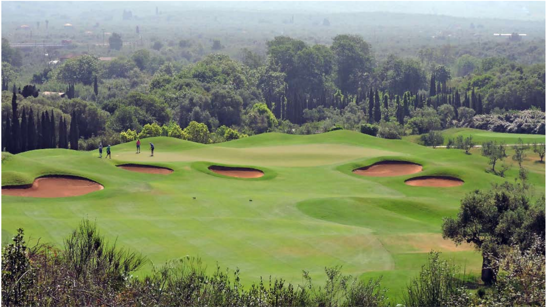
Vacker vy över ett av alla fina golfhål på The Dunes Course.