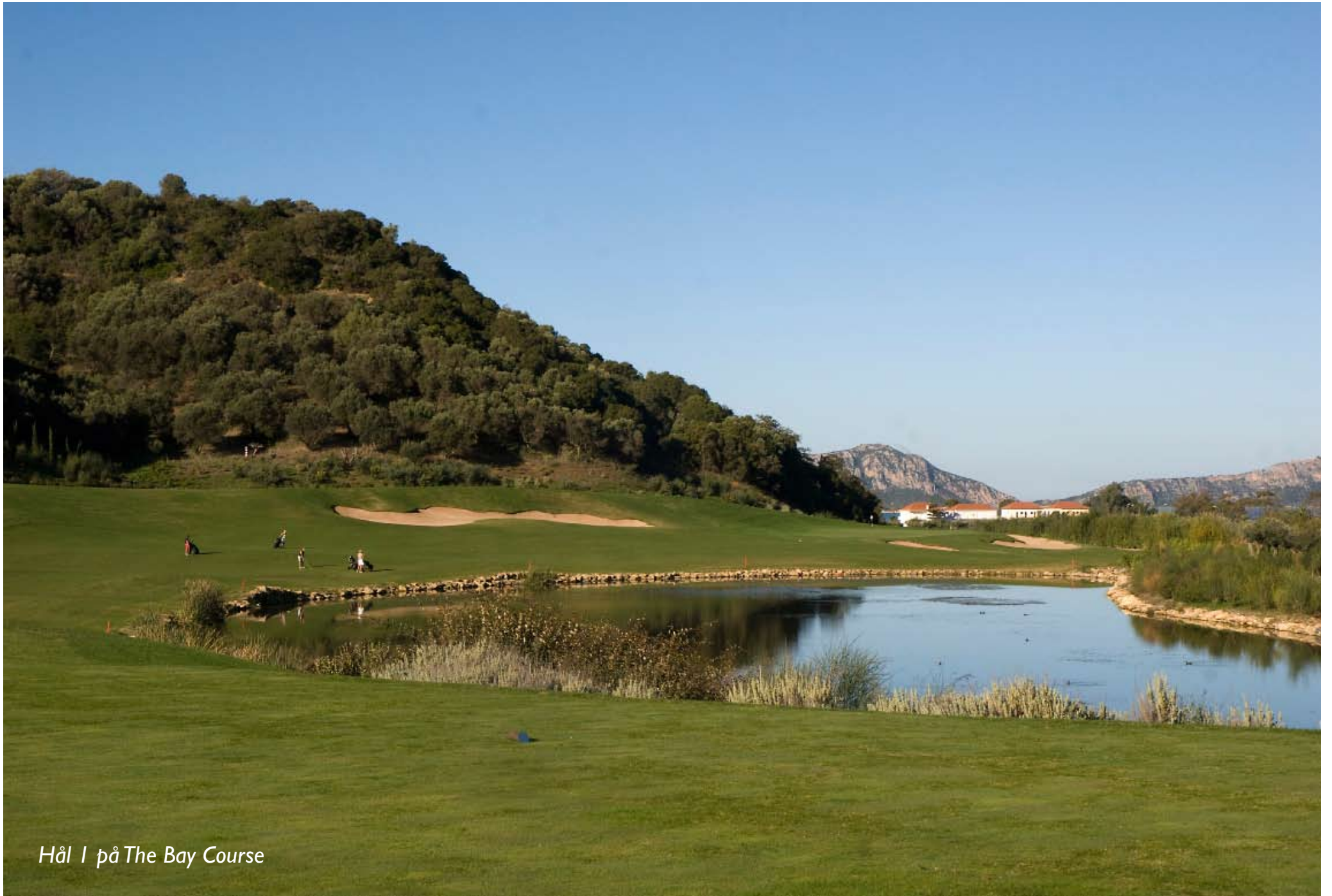
Hål 1 på The Bay Course