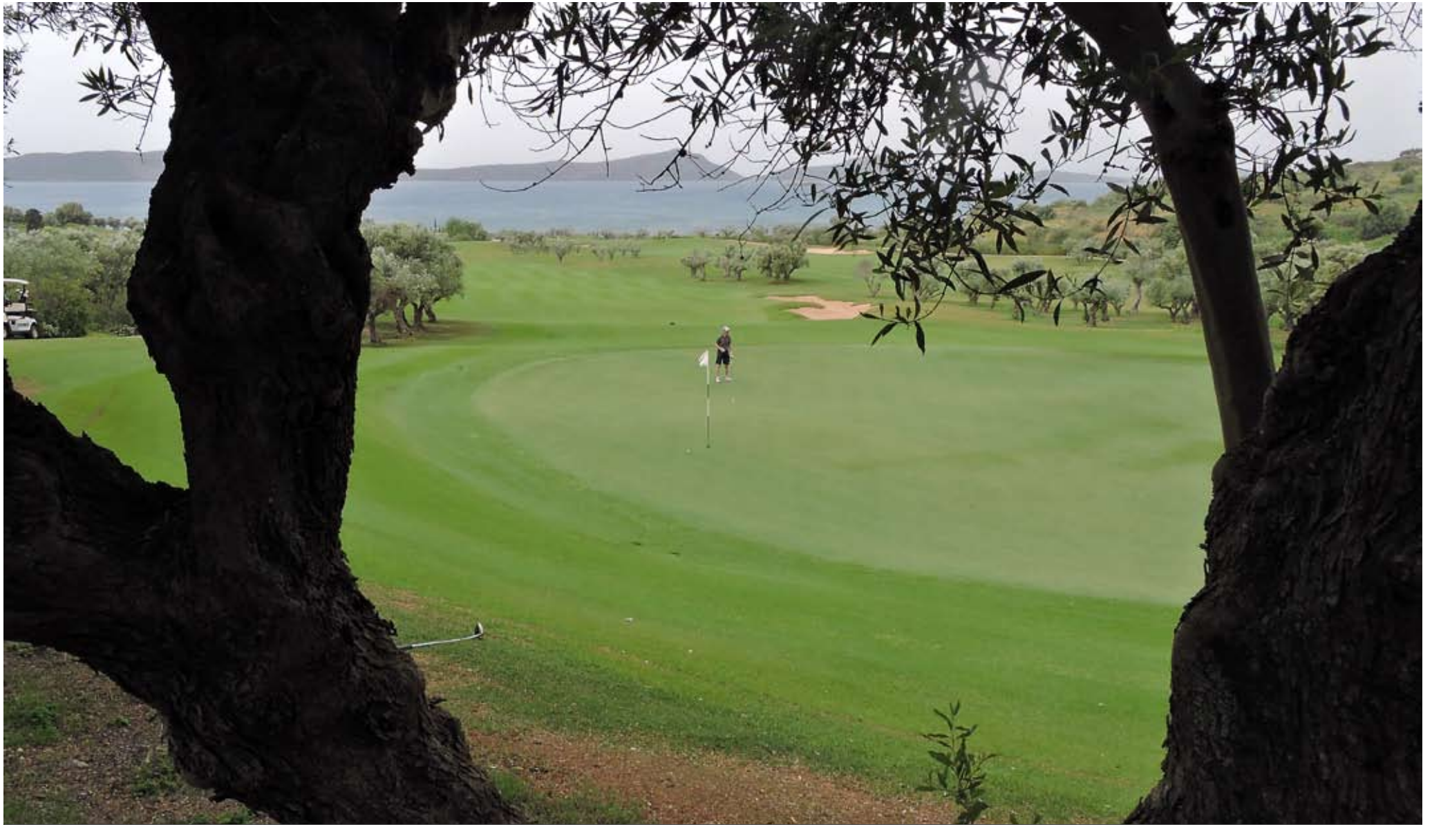
De gamla olivträden, kantade banorna och liknade gamla rynkiga statyer.